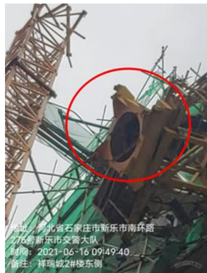
图 2 护套架与回转机构断裂处