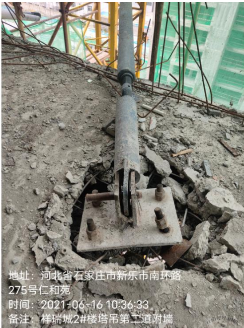
图5 被破坏的第二道附着