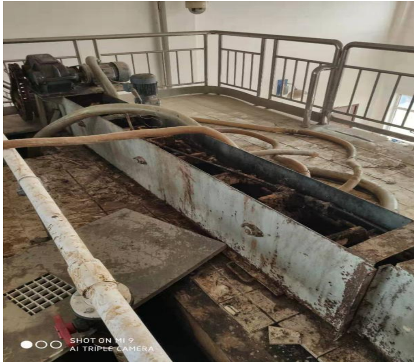
(下图为二期乙酸钠投加间加料口及卸料管图)